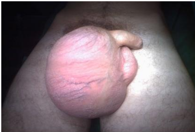
Fig.1. Imagen de inspección de genitales.

epidídimo. El cordón espermático normal y la transluminación del escroto es negativa ( fig. 1 ).