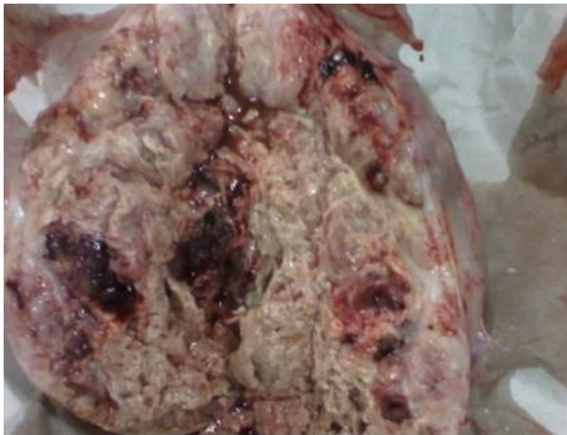
Fig. 3. Imagen de la pieza quirúrgica.

células seminales con patrón mixto (tumor de senos endodérmicos y teratoma maduro).